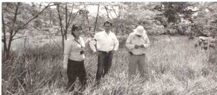
Más bosque, más fauna, resalta Ecopetrol.

Esta actividad está catalogada como línea de contratación local y por ello se ejecuta con empresas de la región, y a su vez genera oportunidades de empleo para la mano de obra no calificada local.