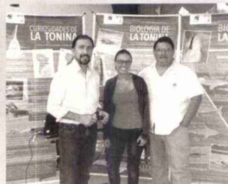
Expertos de la Fundación Omacha lideran el proyecto.

Cormacarena y la Fundación Omacha realizaron un taller sobre el protocolo de avistamiento de las toninas para el departamento del Meta. La importancia de este evento radica en el desarrollo y avance de la estrategia que la autoridad ambiental se ha trazado para la conservación de las toninas o delfín rosado, partiendo desde el conocimiento