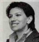
CLAUDIA LÓPEZ SENADORA DE LA REPÚBLICA

"El problema es que si 80% de los colombianos van a quedar descontentos. En este caso el acuerdo será ilegítimo. Las condenas deben ser acordes con la gravedad de los delitos cometidos".