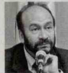
ALFREDO RANGEL SENADOR DE LA REPÚBLICA

"Una justicia restaurativa es aceptable. El problema es que hay líderes de la guerrilla, presentes o no en La Habana, que merecen condenas más fuertes o duras porque podrían parecer blanda".