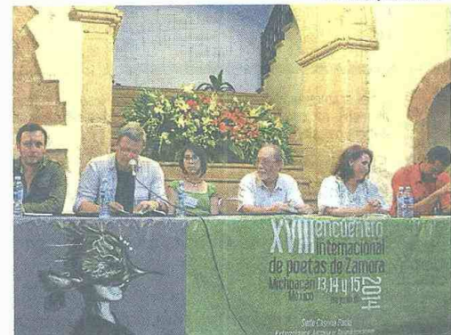
El homenaje a Carlos Pachón se realizó durante el XVIII Encuentro Internacional de Poetas de Zamora, realizado en Michoacán (México).