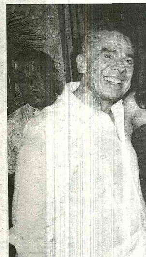
El viernes pasado celebró los 50 años d

Tengo la fortuna de decir que nunca he tenido un día de descanso entre un empleo y otro. Realmente siempre pasé de una empresa a la otra porque me ofrecían opciones siempre de mejorar, hasta estar hoy aquí vinculado con varias de las compañías que hemos querido que sean importantes para la región. Por eso hemos estado vinculados a Caesca, a Licorsa, al Atlético Huila, al CDA Óptimo y otras que no son tan populares.