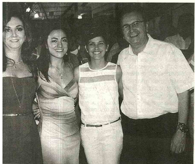
desca, una de las compañías más grandes del Huila.

Todos queremos la paz. El único riesgo con la paz son los beneficios, no hay más. Habrá una etapa de transición, pero una etapa pacífica es menos costosa en vidas que la confrontación. Los colombianos que hemos perdido en esta lucha y en esta confrontación han sido muchos, en todos los órdenes, porque no solo han sido los militares y policías, sino campesinos, empresarios, jueces.