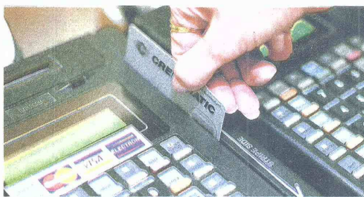
LASTENDENCIAS al uso de las tarjetas de crédito y débito cada vez son mayores y de esa forma se puede notar una diversificación del consumo.

quiere que haya una concertación y no un decreto. Frente a los medios de comunicación aseguró que la orden del presidente de la República, Juan Manuel Santos, era negociar por lo que si era el caso de que tuvieran que extender las reuniones se convocaría a más encuentros. El Ministro está convencido que las dos partes quieren ceder y que el Gobierno hará todo lo posible para llevar las reuniones a un feliz término, en el que empresarios y trabajadores queden conformes.