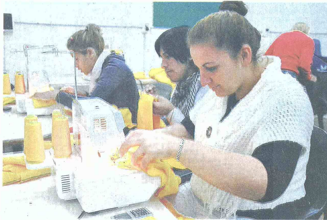
LA EXPECTATIVA gira en torno a las decisiones que se puedan tomar desde la mesa de concertación en la que participan representantes de trabajadores, empresarios y el Gobierno.

Stefano Farné, director del Observatorio Laboral de la Universidad Externado de Colombia, asegura que se ha tomado de costumbre es que el empresario oferte una cifra cercana a la fórmula y el sindicalista más lejano a la misma. "La propuesta de los empleadores no aumentó ni siquiera en un punto, el aumento fue simbólico. Sin