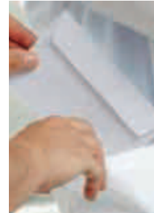
La práctica de soborno continúa afectando a las empresas colombianas, según encuesta.

También se espera que las empresas implementen más sistemas de autorregulación para fomentar la competencia justa. PUBLIMETRO