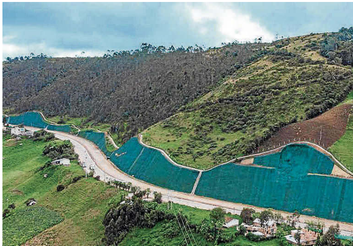
Unión del Sur

“Este corredor en doble calzada es una apuesta estratégica de infraestructura fundamental, no solo para la competitividad de la región Pacífico sino para todo el país, teniendo en cuenta que Ecuador es el cuarto destino de las exportaciones de Colombia. Los resultados de este estudio nos permiten conocer datos para trazar una ruta de trabajo público privada y, con ella, seguir avanzando articuladamente en la consolidación de los cuatro tramos