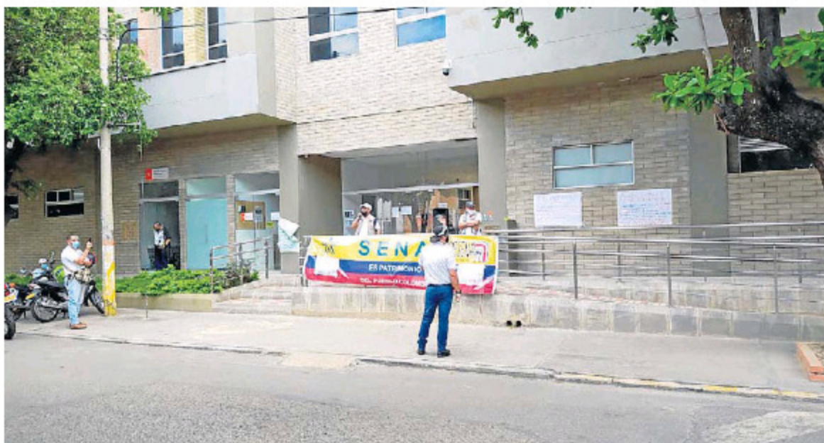
LOS TRABAJADORES REALIZARÁN LOS PLANTONES PACÍFICOS todos los jueves, con el fin de ser escuchados y evitar que la privatización de la entidad se haga efectiva.

Ascanio manifestó que el formato de las multinacionales no obedece a la formación profesional integral que siempre ha garantizado la institución, ya que los programas perderían su enfoque práctico y quedarían