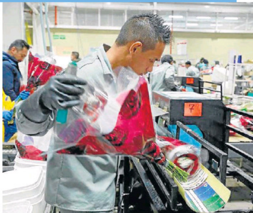
YA SE TIENEN VARIAS VACANTES abiertas, pero el número de hojas de vida recibidos de personal venezolano es muy bajo.