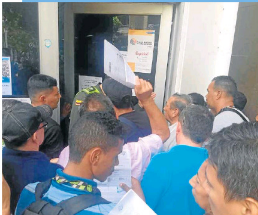
EL MERCADO LABORAL COLOMBIANO puede aprovechar también la inclusión de migrantes venezolanos para levantar la economía en tiempos de coronavirus.