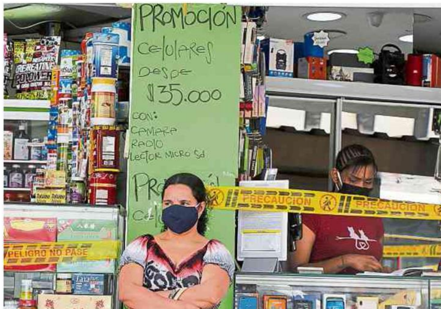
Los académicos manifestaron estar en contra de la posibilidad de subir el IVA a toda la canasta familiar.

También aseguró que se mantuvo la proyección de inflación para el 2021 en 3%, con un rango entre 2% y 4%.