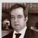
MAURICIO PERFETTI DIRECTOR DEL DANE

"Esta tasa significa que 562.000 colombianos encontraron empleo en julio de 2015. La generación de empleo en las ciudades es la más baja en los últimos 15 años".