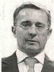
Alvaro Uribe Vélez, expresidente.