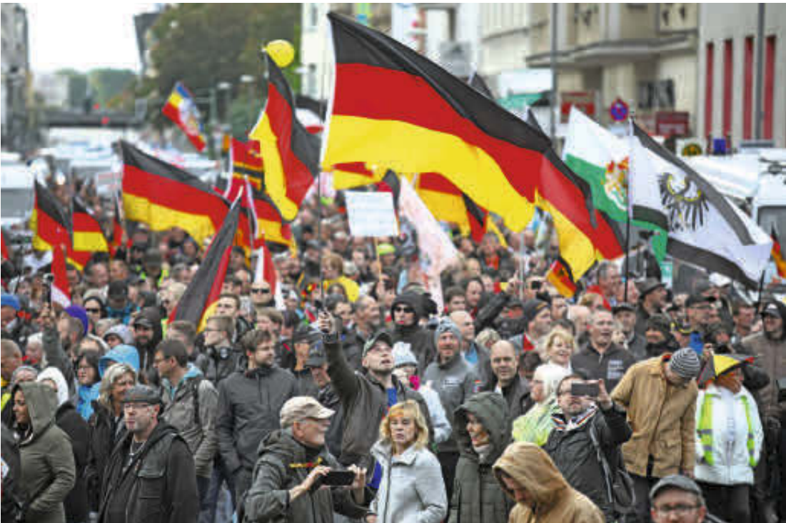
Esta es la imagen de una movilización de derecha que se realizó en Berlín para conmemorar el Día de la Unidad Alemana. También hubo marchas de izquierda y neonazis.