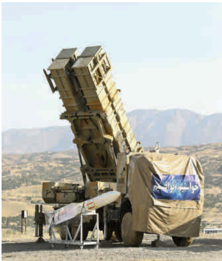
Baterías de misiles antiaéreos, como la de la imagen, permanecen desplegadas en las costas de Irán.

Desde su llegada a la presidencia, Trump ha calificado a Irán como “la nación que apo-