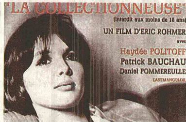
MAÑANA en la Sede Principal de la Alianza Francesa a las 6:30 p.m., se estará proyectando la cinta 'La collectionneuse', una película dirigida por Eric Rohmer, con una duración de 90 minutos, que narra la historia de una pareja que vive un verano separados.