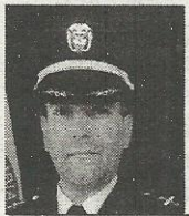
CORONEL NELSON PÉREZ AVELLANEDA

Un Ejército Bicentenario que se transforma para enfrentar las amenazas