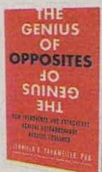
JENNIFER KAHNWEILER BERRER KOEHLER PÁGS. 168

Para conocer los hechos que marcaron la reciente jornada electoral en el país.