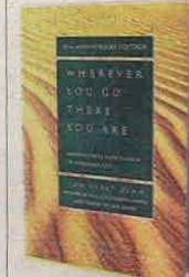
JOHN KABAT-ZINN HYPERION PÁGS. 304