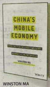
WINSTON MA WILEY PÁGS. 304

•Cómo manejar el cambio y la transición en las organizaciones.