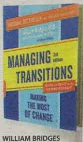
WILLIAM BRIDGES DA CAPO PRESS PÁGS. 144