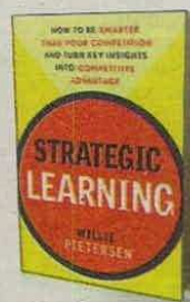
WILLIE PIETERSE WILEY PÁGS. 260

•Qué cualidades puedes desarrollar para ser knowmad y cómo representarán una ventaja.