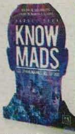
RAQUEL ROCA LID EDITORIAL PÁGS. 320

•Cómo las organizaciones pueden priorizar el significado antes que las ganancias.