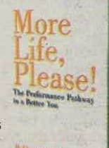
VARIOS AUTORES URBANE PUB. LIM. PÁGS. 272

•Qué implica el modelo. •"Rendimiento de optimización de los recursos personales". •Cómo contribuir y experimentar una vida familiar más plena.