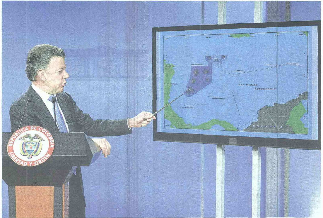
El presidente Juan Manuel Santos explica cuál es el territorio que está en pleito con Nicaragua y su plan estratégico para recuperarlo.

La estrategia se dividió en cuatro pasos, el primero hacer referencia a que el dicho fallo de la CIJ no es aplicable sin un tratado. El segundo paso de la estrategia es la consolidación del archipiélago a través de la declaración de una Zona Continua Integral a lo que el Jefe de Estado dijo "con base en las leyes colombianas y teniendo en cuenta principios claros de