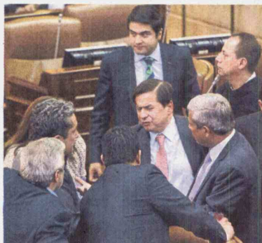
El ministro Juan Fernando Cristo estuvo atento de que los congresistas no se ausentaran de la votación.

"Sentimos un ambiente enrarecido en la Cámara para votar el eje de justicia".