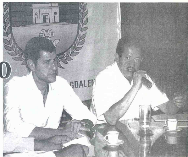
EL VICEPRESIDENTE se comprometió a lograr un acercamiento entre las partes. Asimismo, condenó las amenazas por parte de la banda criminal 'Los Rastrojos', e hizo un llamado al presidente de Drummond para que se pronuncie por tales actos. / MIGUEL ORTEGA.

En sus palabras, Garzón anunció que le pedirá al Presidente de la multinacional sentarse a dialogar con el sindicato que agrupa a 2.700 empleados. "Drummond debe someterse a la ley colombiana. La Drummond no puede estar por encima del gobierno colombiano ni de nuestra ley. La política de Colombia es el diálogo y la concertación. Me voy de esta reunión con la sensación de que Sintramienergética quiere el arreglo y