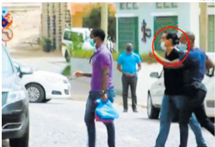
El abogado Baltasar Garzón pidió la “liberación inmediata” del colombiano.

“En estos cinco meses en los que el señor Saab lleva detenido, no se le ha permitido tener acceso a aten-