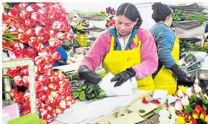
Aunque sigue siendo alto y superior al de los hombres, el desempleo femenino cayó más rápido que el masculino.

asistenciales y de generación de activos en favor de las familias pobres y la intensificación del control y vigilancia oficiales en el trabajo.