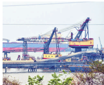
Desde hace un año, el embarque del carbón obligatoriamente se debe hacer en el puerto, y no con barcazas.

agencia que los envíos podrían reanudarse esta semana o la próxima.