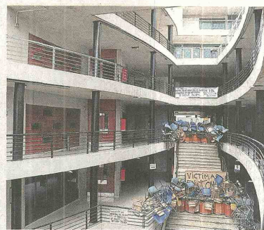
La mayoría de estudiantes de Colombia no saben qué hacer, pues no han recibido una respuesta oficial del gobierno chileno.