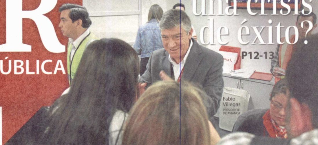
Fabio Villegas PRESIDENTE DE AVIANCA

LAS INDUSTRIAS CREATIVAS PUEDEN SER LA ESPERANZA DE LA ECONOMÍA