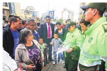
En la carrera 10ª, en el centro de Bogotá, un grupo de policías alerta a los ciudadanos sobre una banda de atracadores.

das y bancos, el Alcalde señaló que "son objeto de hurto por bandas especializadas. Estas han sido débilmente golpeadas. Por su parte, el fleteo, por ejemplo, se desplomó debido a que esas bandas sí fueron fuertemente golpeadas".