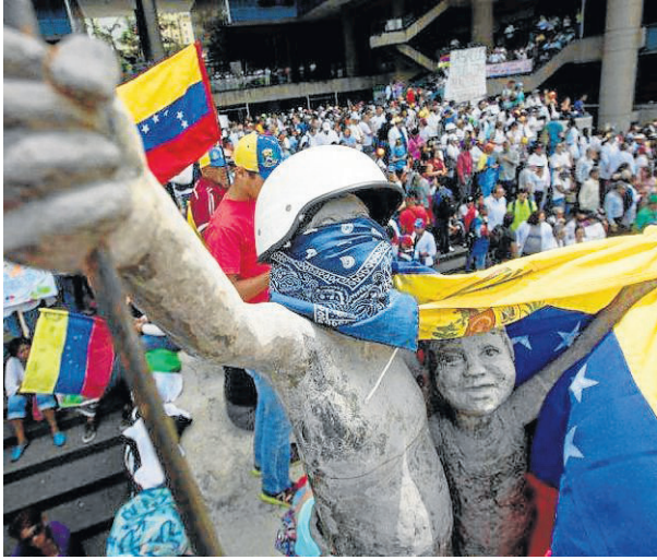
VANGUARDIA / EL NUEVO DÍA

Arreaza reiteró que el Ejecutivo de Maduro no reconoce “ningún mecanismo politizado e inquisidor, creado con fines ideológicos por países con pésimos