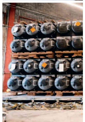
Los ciudadanos ucranianos se están

rar con las naciones que pertenecían a la Unión Soviética y que devuelva todas sus fronteras militares a los puntos en los que estaban en 1997.