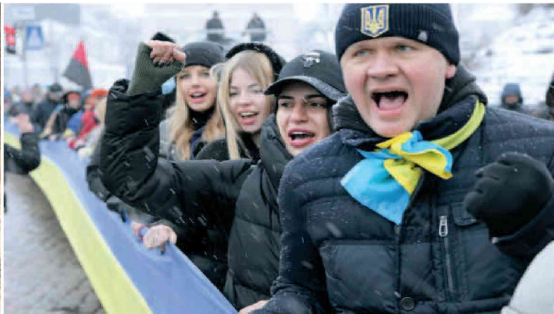
movilizando para defender el territorio de su país de otra posible invasión de Rusia.

"Si falla la diplomacia, estamos muy avanzados en la preparación de la respuesta".