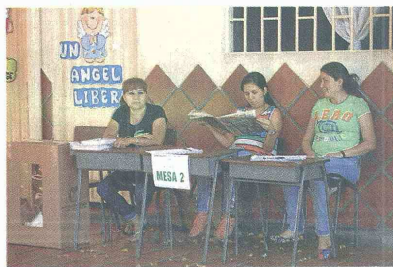
ANTE LA FALTA DE VOTANTES, los jurados no tuvieron más remedio que buscar distracción mientras transcurrían las ocho horas de las votaciones.

De hecho, hasta los listados que se instalan cerca a los puestos de votación para ubicación de los electores se los llevó el viento, sin que nadie se percatara de su existencia. A las afueras de los cubículos electorales, mientras, muchos disfrutaban de un domingo normal, asistían en masa a las iglesias, disputaban encuentros deportivos con sus amigos o familiares y se paseaban por la ciclo vía en El Malecón, desconociendo el proceso electoral que estaba en curso y al que estaban convocados más de