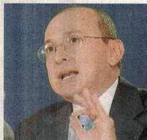
EDUARDO MONTEALEGRE, fiscal general de la Nación.

Según el tribunal de lo contencioso administrativo, la exfiscal debió haber sido elegida por 16 votos, los dos tercios partes del total de los 23 magistrados, y no por los 14 con los que ganó.