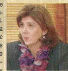
María Angela Holguín

Durante la semana, el equipo tiene una agenda de reuniones con entidades de Estado que incluye encuentros con los Ministerios de Justicia, Interior y Defensa; el Programa Presidencial de Derechos Humanos y Derecho Internacional Humanitario; la Oficina del Alto Comisionado para la Paz; la Unidad de Restitución de Tierras; la Unidad para la Atención y Reparación Integral a las Víctimas; y la Fiscalía General de Nación. También sostendrán encuentros con jueces, magistrados, congresistas y organizaciones de la sociedad civil.