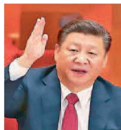
XI JINPING Presidente de China