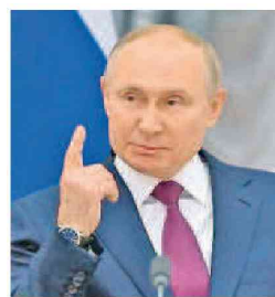
VLADÍMIR PUTIN Presidente de Rusia

Tras el respaldo de China, Rusia aseguró que rechaza cualquier interferencia en los asuntos internos de Pekín.