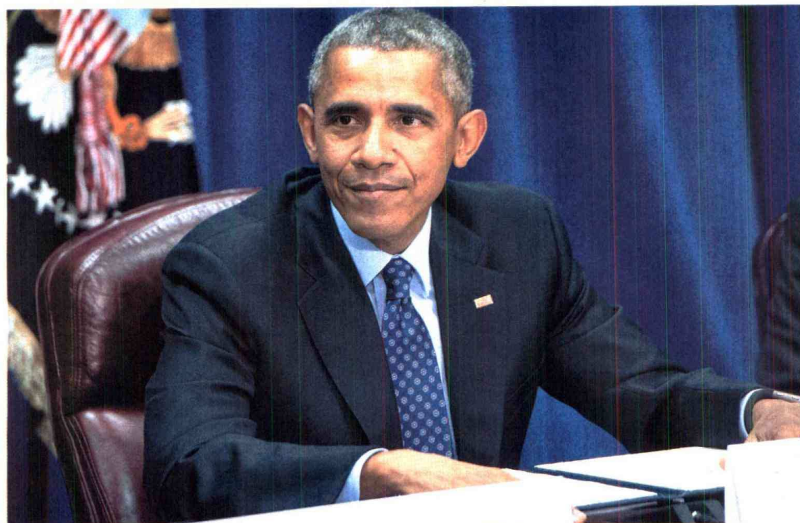
Barack Obama, presidente de Estados Unidos.