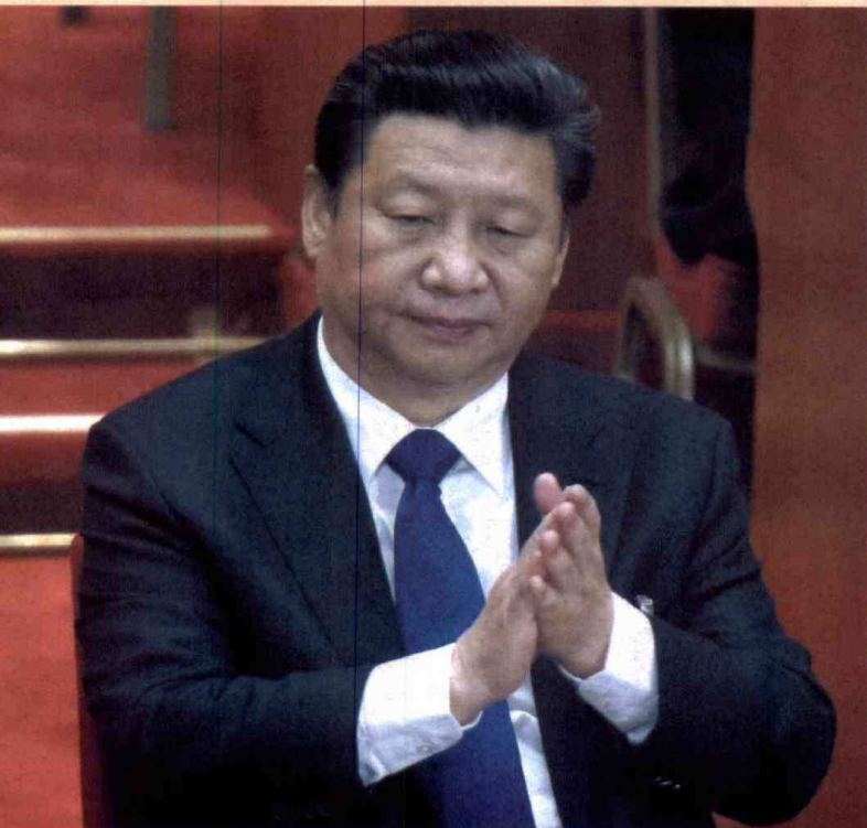
Xi Jinping, presidente de China.

dente de la Asociación Nacional de Comercio Exterior (Analdex), Javier Díaz, nos vinculó con los países latinoamericanos pero no con los "grandes jugadores" de la economía mundial.