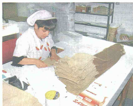
COLOMBIA ES OCTAVO en oportunidades de empleo femenino a nivel mundial.

Dentro de la lista de países emergentes, los más rezagados de la región son Argentina 47,3%, seguido de Chile 47,1% y México 44,3%. Aunque vale la pena mencionar que