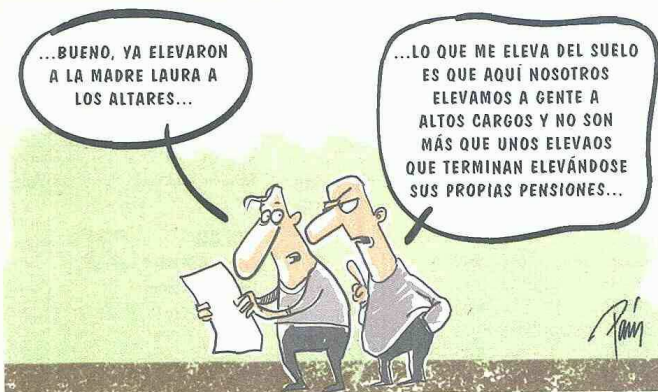
ILUSTRACIÓN ESTEBAN PARÍS