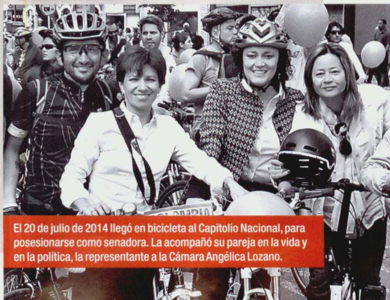
El 20 de julio de 2014 llegó en bicicleta al Capitolio Nacional, para posesionarse como senadora. La acompañó su pareja en la vida y en la política, la representante a la Cámara Angélica Lozano.