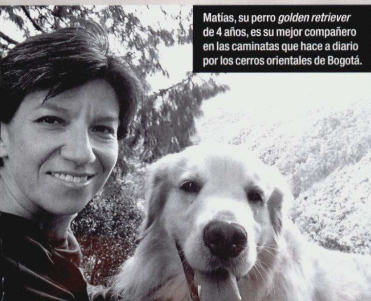
Matías, su perro golden retriever de 4 años, es su mejor compañero en las caminatas que hace a diario por los cerros orientales de Bogotá.