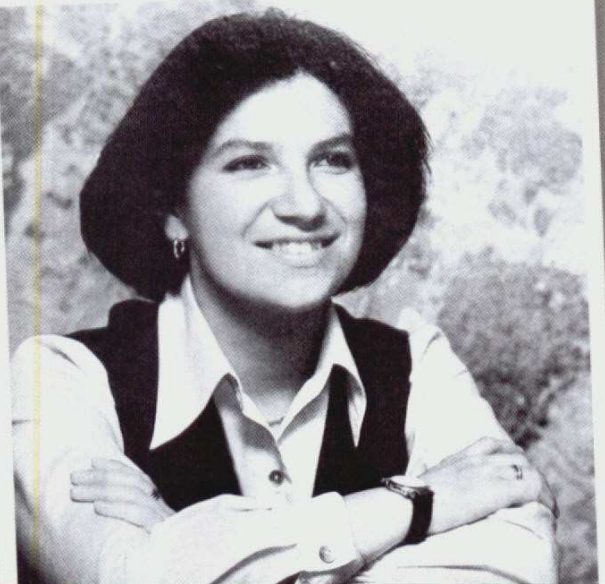
En los años de estudiante ya dejaba ver su interés por la política: participó en el movimiento estudiantil de la Séptima Papeleta.