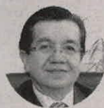
Fernando Ruiz Ministro de Salud

Fue identificado por primera vez el 9 de enero de 2020