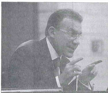
ROY BARRERAS, presidente del Senado de la República.

Los que se han mostrado más cautelosos frente a la elección del procurador son los liberales, quienes aún no revelan su voto. Como lo aseguró, el senador liberal Eugenio Prieto, al indicar que lo único que ha decidido su colectividad es que van