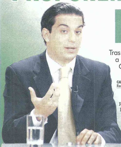
Simón Gaviria, jefe del Partido Liberal, asegura que el país debería afrontar el debate.