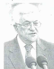
Mahmud Abás, presidente.

El paso de Rafah, al sur, con Egipto, se abrirá con presencia de fuerzas de la Autoridad Palestina. "Egipto e Israel han consolidado una sólida alianza para evitar que luego del cese al fuego Hamás y otras facciones vuelvan a armarse, por eso acordaron que los cruces