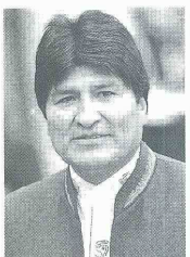
Evo Morales, presidente.

LA PAZ. El Gobierno boliviano aprobó el pago de un aginaldo cada mes de diciembre a las más de 800.000 personas mayores de 60 años que perciben en el país el subsidio universal de vejez, denominada "renta dignidad". La aprobación de esta ley tiene lugar a un mes y medio de las elecciones generales en las que Morales buscará un tercer mandato, y la misma semana en que cientos de jubilados salieron a la calle en las principales ciudades de Bolivia para exigir el cobro del segundo aginaldo navideño que perciben desde el año pasado los trabajadores públicos y privados.