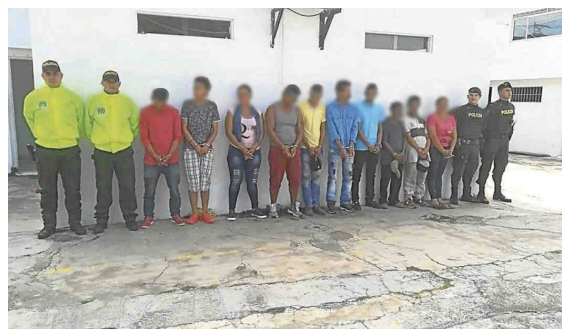
La banda criminal operaba en Bogotá y el norte de Cundinamarca.

"Al parecer, los uniformados eran los encargados de evitar que la policía reaccionara cuando los hurtos eran reportados y, supuestamente, proveían uniformes y otros elemen-