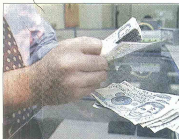
FUE radicado para su aprobación en plenaria el proyecto de ley que busca el desmonte gradual del 4 por 1.000. El impuesto se reducirá paulatinamente hasta el año 2015.