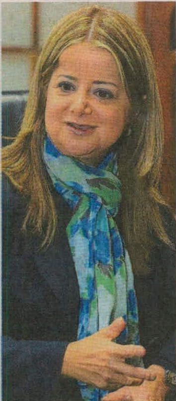
Elsa Noguera, nueva gobernadora del Atlántico.