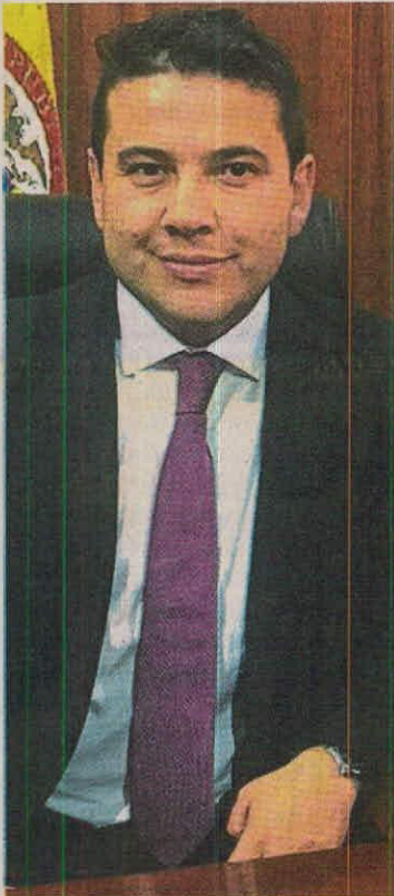
Nicolás García ejercerá como gobernador de Cundinamarca.