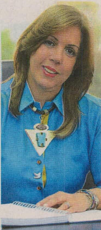
El Valle del Cauca será gobernado por Clara Luz Roldán.