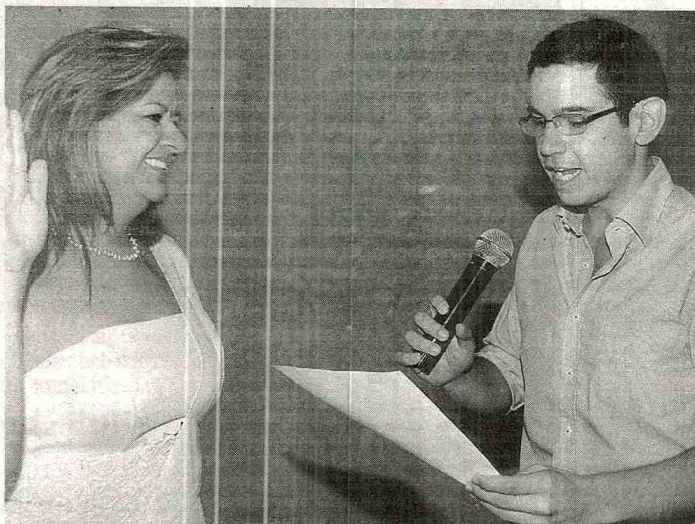
El día de su posesión como Contralora Departamental del Huila.

Esa pregunta la deben contestar los funcionarios de la Contraloría (risas).