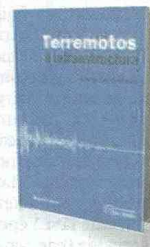
ALBERTO SARRIA U. EXTERNADO PÁGS. 542

El libro "Terremotos e Infraestructura" se concentra en la ingeniería civil y los conceptos de la sismología. Los estudiantes y profesores tendrán una guía para los proyectos de infraestructura que tienen la necesidad de construirse en zonas con altos índices de peligros sísmicos. En el texto se encontrarán también con la manera de hacer las obras de este tipo mucho más económicas y seguras. El libro ya presenta su segunda edición en la que se modificaron varios de los capítulos y se agregan temas como los maremotos y los manejos con las industrias de seguro del país, se muestran los problemas y las dinámicas para resolverlos. Se puede encontrar desde US$482, 50.