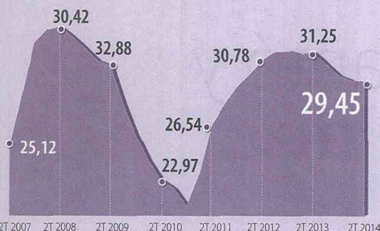
Comportamiento histórico de la tasa de usura Cifras porcentuales