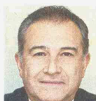
El general Oscar Naranjo será clave en el Gobierno.