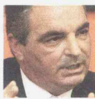
Aurelio Iragorri pasaría a Agricultura.