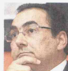
Sergio Díaz-Granados, posible Canciller.