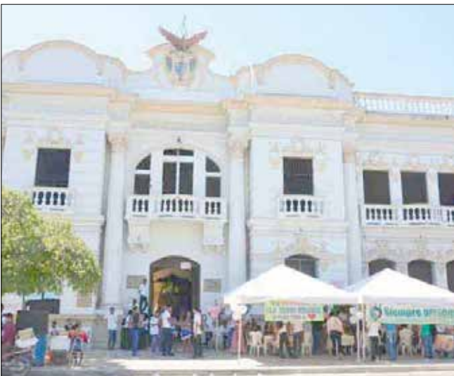
La IED Técnico Industrial se vestirá de fiesta desde hoy para exaltar los proyectos de sus alumnos.

A partir del 1 de octubre, en todas las sedes de la Institución Educativa Distrital Técnico Industrial, la tecnología, la ciencia y la cultura serán los protagonistas de la ‘Gran Semana Técnica’, actividad en la cual los estudiantes con ayuda de sus docentes expondrán sus proyectos en los diferentes frentes que imparte conocimiento el plantel educativo. Los estudiantes harán exposiciones de talleres de ebanistería, sastrería, mecánica industrial, herrería,