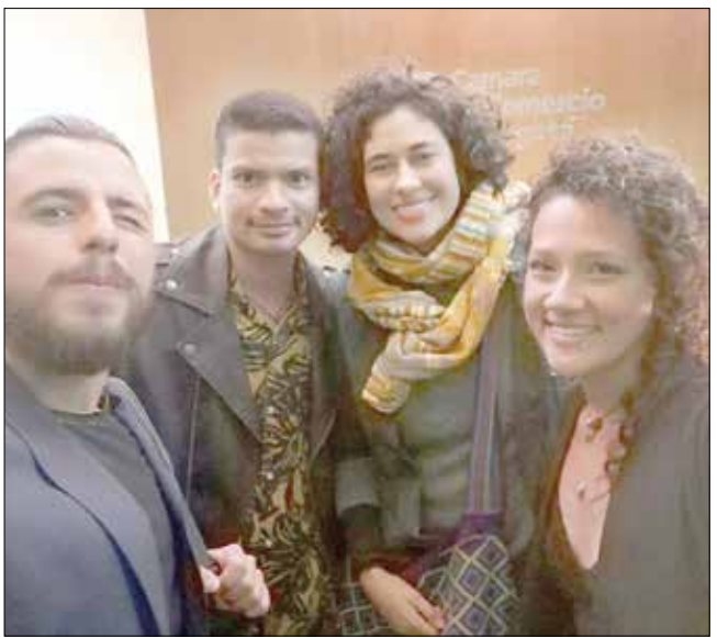
Unimagdalena fue protagonista en Fondo Cinematográfico Colombiano y en el Portafolio Distrital de Estímulos ‘Germán Vargas Cantillo’.