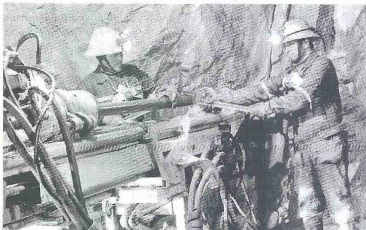
Se confía en un manejo adecuado del sector minero-energético.

Ahora, los grandes retos para la economía colombiana, según Fitch, son recuperar el crecimiento del que se gozó en la primera mitad de 2012, solucionar los paros y protestas de los diversos sectores, ejecutar el plan de inversiones en infraestructura, mejorar la competitividad externa y generar empleo según lo planteado con la reforma tributaria. Igualmente, los analistas coinciden en que las reformas de pensiones y de salud serían claves para aumentar la nota del país, mientras que avances en el tema de la paz generarían un mejor clima de negocios, lo que atraería mayor inversión hacia Colombia.