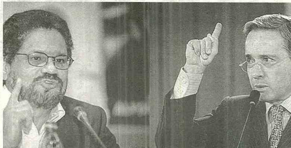
Luciano Marín Arango, alias "Iván Márquez", y Álvaro Uribe Vélez.

El expresidente Álvaro Uribe (2002-2010) ha manifestado en reiteradas ocasiones su oposición a los diálogos de paz que desde el