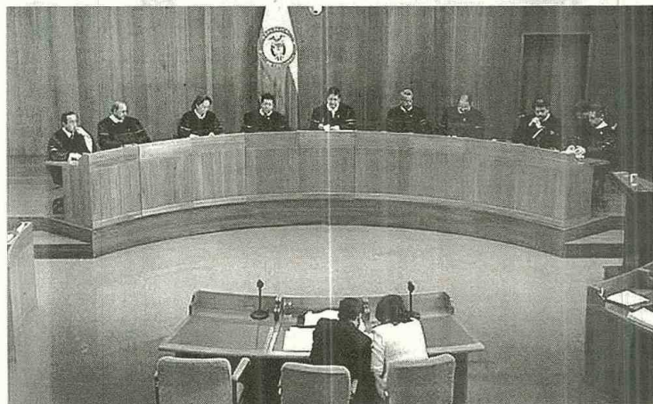
La Sala Plena de la Corte Suprema de Justicia conformó la terna.

La Sala Plena de la Corte Suprema de Justicia conformó la terna de aspirantes al cargo de Auditor General de la República, quienes presentarán en una audiencia sus credenciales ante el Consejo de Estado.