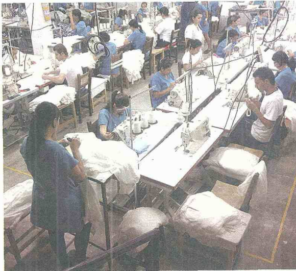
En el sector industrial, según la ANIF, se han perdido 164 mil empleos durante este año. Le sigue el agrícola.